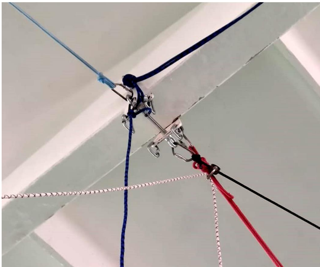
Фото 1. Взаимное расположение перил и ВСС на ТО-3